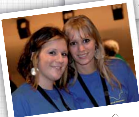
festival 2009 ↗