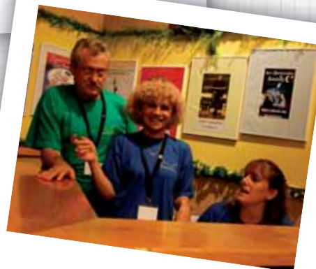
festival 2009 ↗