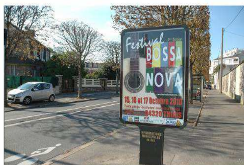
Dans la ville