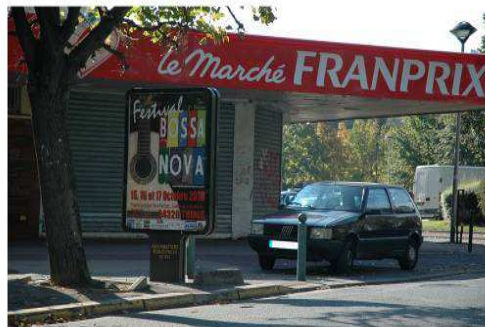
Dans la ville